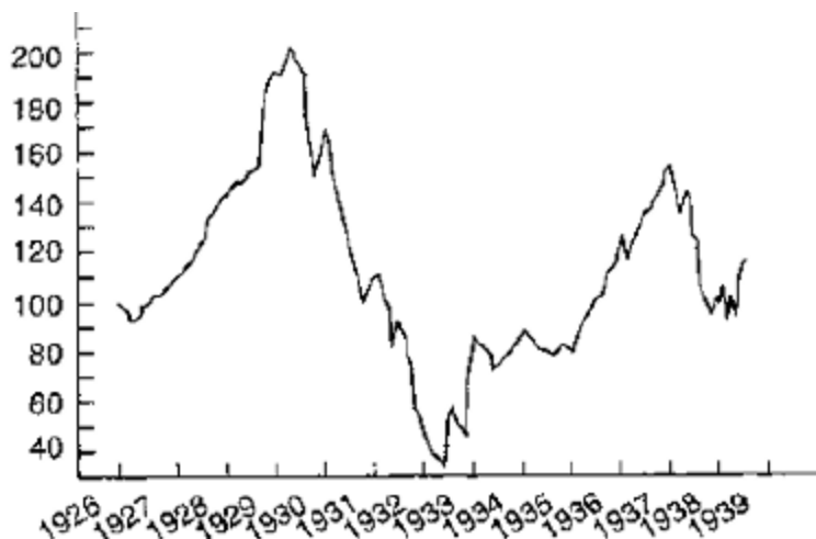
Gráfico 4 – Cotação das ações na Bolsa de Nova York entre 1926 e 1938.

Ainda segundo Gazier (2013) a evolução dos três anos entre 1929 e 1932, apesar de não-originada em rupturas de 24 horas como esta, seria igualmente catastrófica.