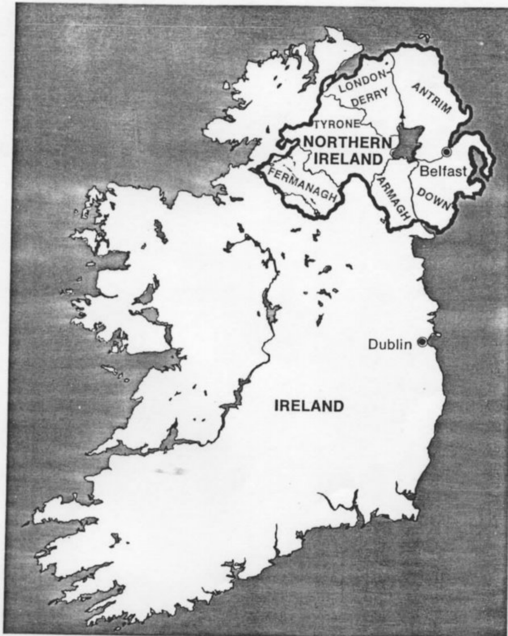
Figura nº 3