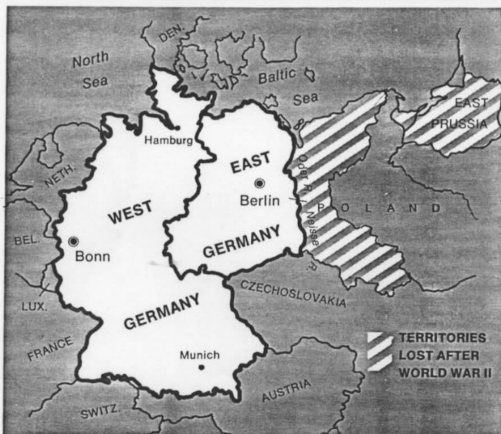
Figura nº 1